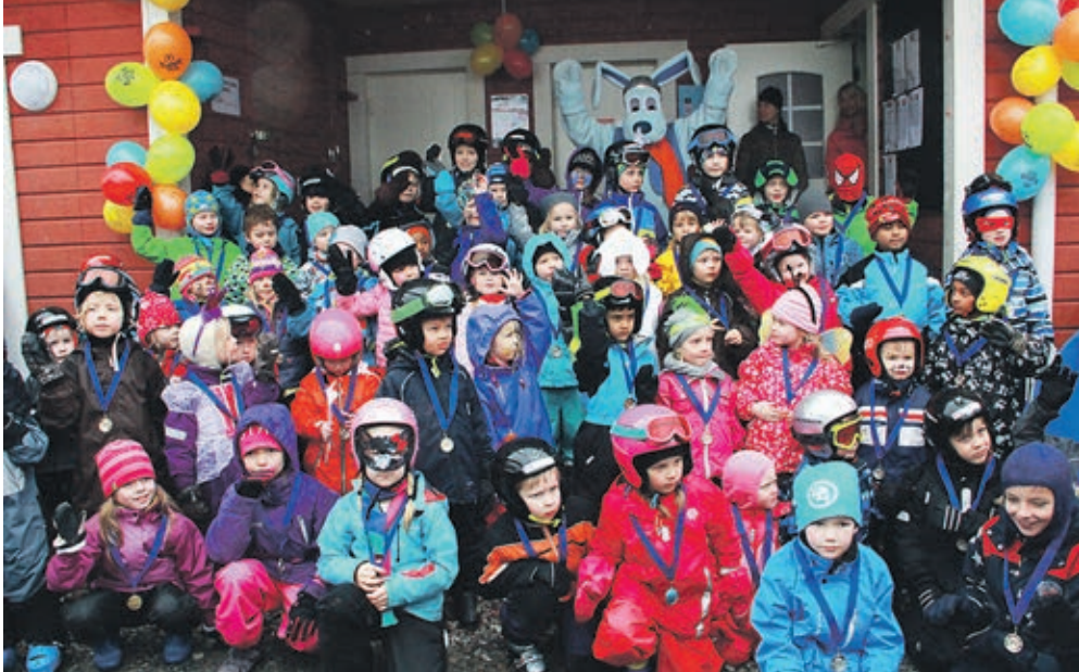
Onnelliset hiihtokoululaiset palkittiin mitaleilla yhteistyössä investointipankki Evlin kanssa Kauniaisten mäen 80-vuotisjuhlavuoden kunniaksi.

Lyckliga skidelever belönades med medaljer i samarbete med investeringsbanken Evli för att ära Granibackens 80-årsjubileum.