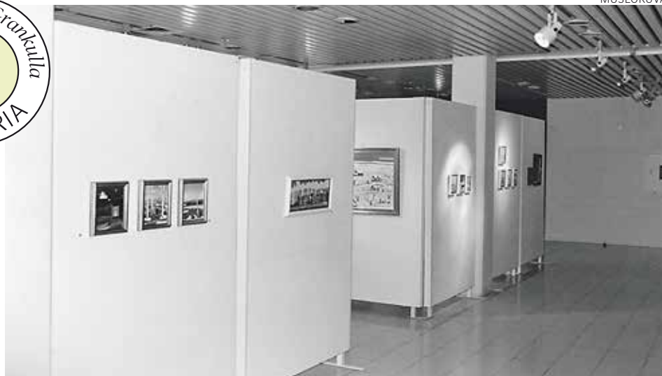
Aulan siirrettävät näyttelysermit, suunnitteli Yrjö Kukkapuro, 1980-luku. Aulans skärmar för växlande utställningar, design Yrjö Kukkapuro, 1980-talet.

För oss som gavs arbetsrum i den splitternya byggnaden var det ett hus som på alla sätt kändes rätt. Jag satt några år i nedre våningen, sedan många år uppe i andra våningen. Arbetsandan var god och man kände samhörighet. Huset hade en egen gårdskarlar med familj som gärna dök upp i rum och korridorer