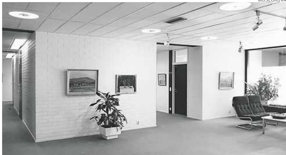
Yläaula, jossa on kolme Mikko Laasion maalausta ja taustalla Rabbe Enckellin maalaus, 1980-luku. Övre hallen med tre tavlor av Mikko Laasio. En tavla av Rabbe Enckell i bakgrunden, 1980-talet.