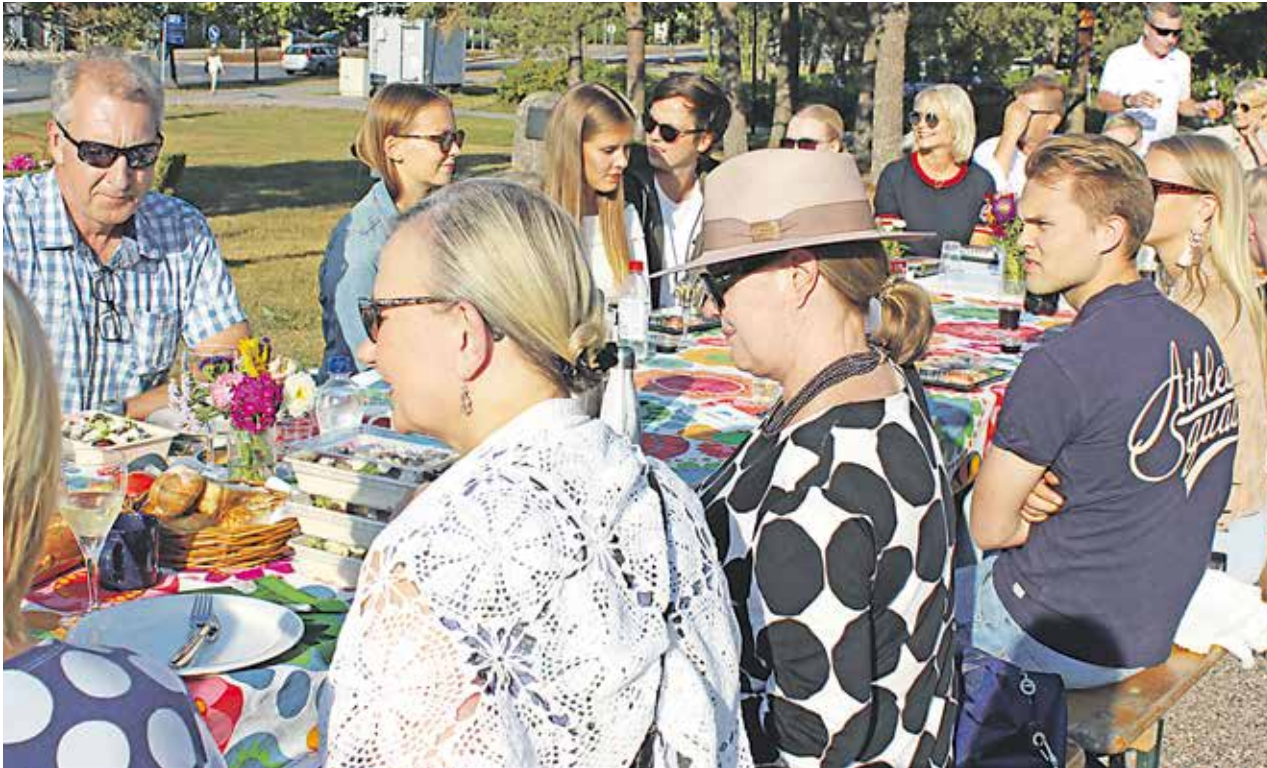
Tältä näytti viime vuonna. Elokuussa syödään taas yhdessä Granissa. Ilmoittautuminen tapahtuu tämän osoitteen kautta: tilaisuudet@graninilahiapury.fi .

Så här såg det ut ifjol. I augusti är det igen dags att äta tillsammans i Grani. Anmäl dig via denna adress: tilaisuudet@graninilahiapury.fi .