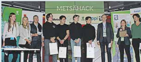
Palkintojen jako käynnissä.

MetsäHackiin osallistui noin 60 opiskelijaa talous- ja yhteiskuntapainotteisista lukioista. Tapahtuman pääjärjestäjänä toimi Kauniaisten lukion osuuskunta Grani Works sekä Puunjalostusinsinöörit ry.