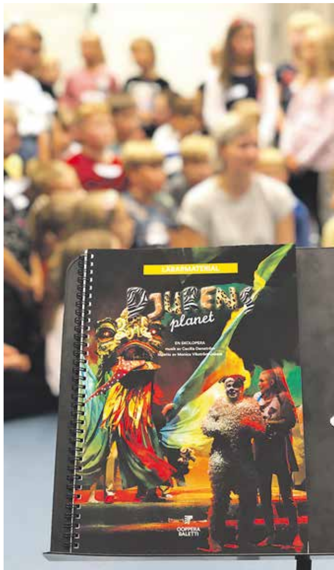
29. lokakuuta on Granhultin oppilaiden aika nousta Kansallisoopperan Almi-salin näyttämölle. Nyt harjoitellaan esitystä ahkerasti.

Koulun oppilaat saavat olla katsomassa kenraaliharjoitusta, joka pidetään klo 14 oopperan esittämispäivänä. Illalla klo 18 on yleisöesitys. Koulu myy tilaisuuteen lippuja.