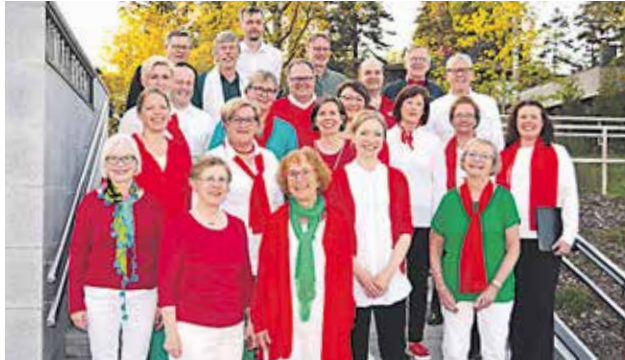
Kauniaisten kamarikuoro matkustaa syksyllä Roomaan. Grankulla kammarkör reser till Rom i höst.