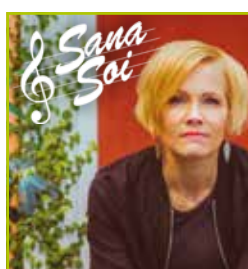
"Liitto Jumalan kanssa"