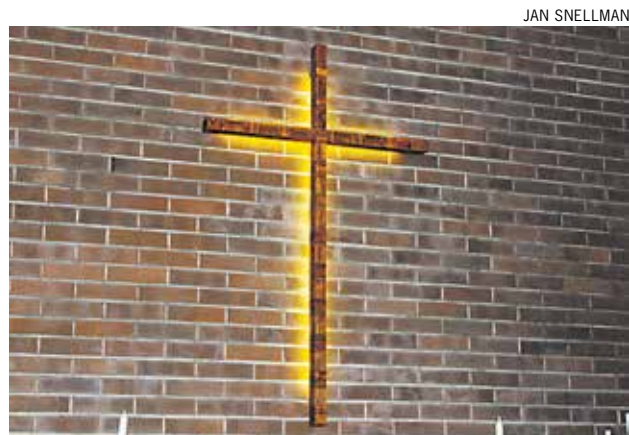
Yli 200 ihmistä osallistuu jumalanpalveluksiin talvisaikaan. Mer än 200 personer deltar i gudstjänsterna om vintern.