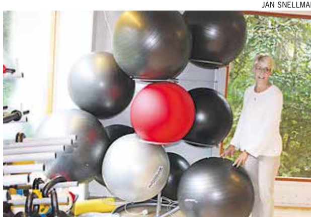
Muutakin kuin tennistä. Hallissa voi myös harrastaa joogaa ja jumppaa.

Annat än tennis. I hallen kan man också hålla på med yoga och gympa.