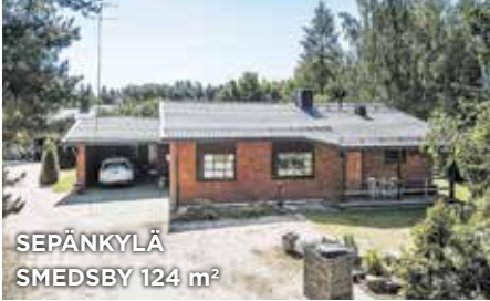
SEPÄNKYLÄ SMEDSBY 124 m 2

KT 4h, k, kph, wc, ph/s, las. parv. Elk:D2013. Mh. 349 000 €. At 35 000 €. Gresantie 18 | HH 4r, k, bdr, wc, tvättr/b, ingl. balk. Elk:D2013 Fp. 349 000 €. Bilgar. 35 000 €. Gräsavägen 18 | Tied./Förf. C. Nyberg 9558314