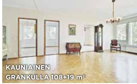
KAUNIAINEN GRANKULLA 108+19 m 2

OKT 5h, k, 2kph, s, 2wc, khh, 2vh, parvi, at, var, piha. Ei lain ed. e-tod. Mh. 1 170 000 €. Suokrouvint. 2 | EHH 5r, k, 2bdr, b, 2wc, hjälpk, 2klädr, loft, garage, förråd, gård. Ej lagenl. e-cert. Fp. 1 170 000 €. Mossakrogsv. 2 | Tied./Förf. C. Nyberg, Mattinen