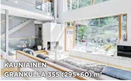
KAUNIAINEN GRANKULLA 355 (295+60) m 2

OKT 5h, k, 2kph, s, 2wc, khh, 2vh, parvi, at, var, piha. Ei lain ed. e-tod. Mh. 1 170 000 €. Suokrouvint. 2 | EHH 5r, k, 2bdr, b, 2wc, hjälpk, 2klädr, loft, garage, förråd, gård. Ej lagenl. e-cert. Fp. 1 170 000 €. Mossakrogsv. 2 | Tied./Förf. C. Nyberg, Mattinen