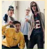
NNS nuorten- illassa la klo 18