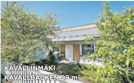
KAVALLINMÄKI KAVALLBACKEN 99 m 2

ET 5h, k, s. Ei lain ed. e-tod. Mh. 465 000 €. Smedsinportti 2 | FRIST.EHH 5r, k, b. Ej lagenl. e-cert. Fp. 465 000 €. Smedsporten 2. | Tied/ Förf. Hellman 9405535