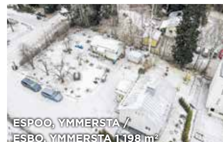
ESPOO, YMMERSTA / ESBO, YMMERSTA 1198 m 2

KT 3h, avok, kph, parv. Elk:F 2007 , Mh. 248 051€. Vh. 259 000€. Laaksot. 3. / HH 3r, öppet k, bdr, balk. Ekl:F 2007 , Fp. 248 051€. Sp. 259 000€. Dalv. 3. Tied./Förf. C. Nyberg 050 4105138 9723233