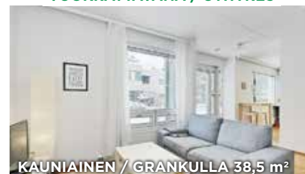
KAUNIAINEN / GRANKULLA 38,5 m 2

KT 1h, avok, kph/s. Elk:G 2007 Vuokra 780 €/kk. Pohj. Suotie 5. HH 1r, öppet k, bdr/b. Ekl:G 2007 , Hyra 780€/mån. Norra Mossav. 5. Tied./Förf. C. Nyberg 050 410 5138 9474862