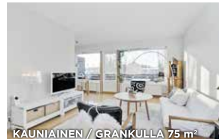
KAUNIAINEN / GRANKULLA 75 m 2

KT 3h, avok, kph, parv. Elk:F 2007 , Mh. 248 051€. Vh. 259 000€. Laaksot. 3. / HH 3r, öppet k, bdr, balk. Ekl:F 2007 , Fp. 248 051€. Sp. 259 000€. Dalv. 3. Tied./Förf. C. Nyberg 050 4105138 9723233