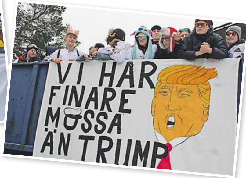
Donald Trump var förstas med under årets bänkskuddardag.

Donald Trump oli tietenkin mukana penkkispäivänä tänä vuonna.