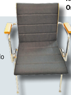
Kaupungintalon verhoiltu tuoli. Omklädd stol i stadshuset.

Perhe: Aviomies, 3 lasta ja koira Harrastukset: Kuntosali, jooga, äitien käsipallo Hauskin huonekalu: Verhoilin kerran Arne Jacobsen-nojatuolin (Egg). Se oli erikoista. Parasta Kauniaisissa: Yhteishenki, helppoa saada yhteys ihmisiin, kaikki on lähellä.