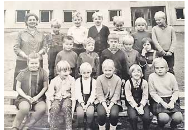
Och 50 år tidigare (så långt som möjligt samma ordning)