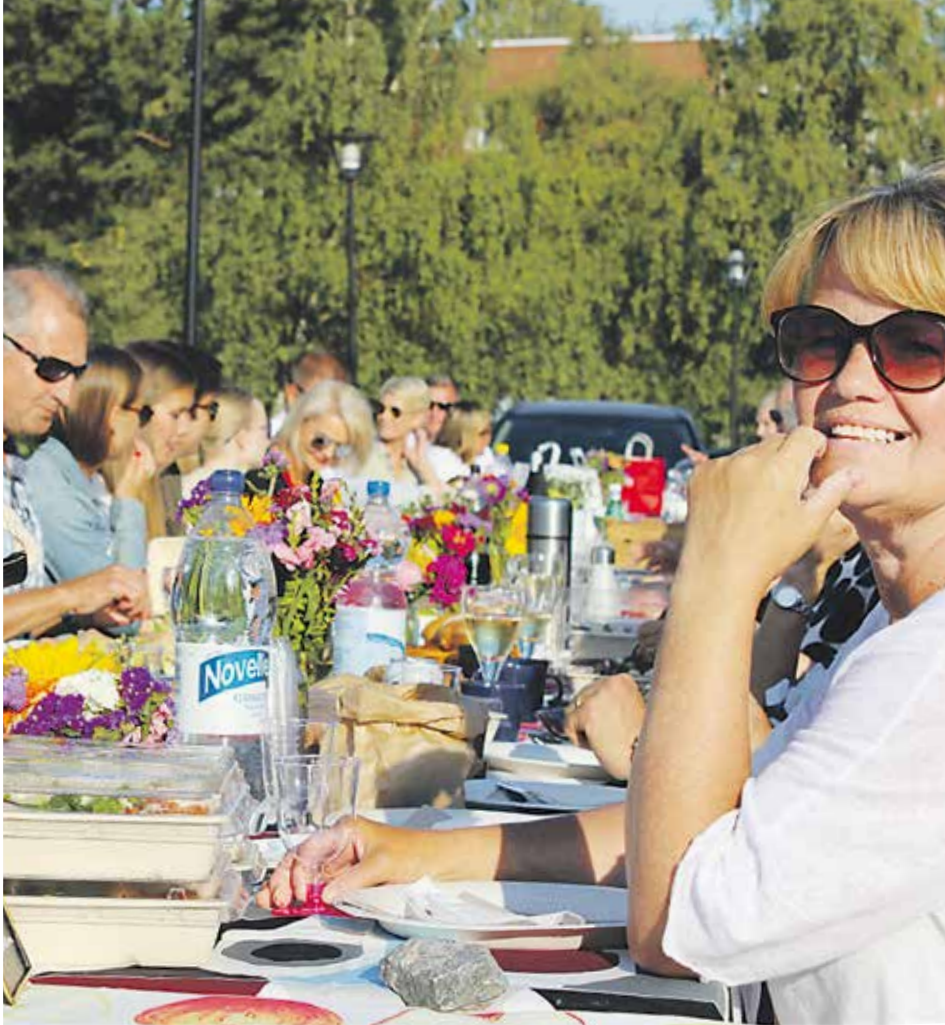
Kesäinen tunnelma. Jatkoa seuraa luultavasti ensi vuonna. Stämningen på topp. Fortsättning följer sannolikt nästa år.