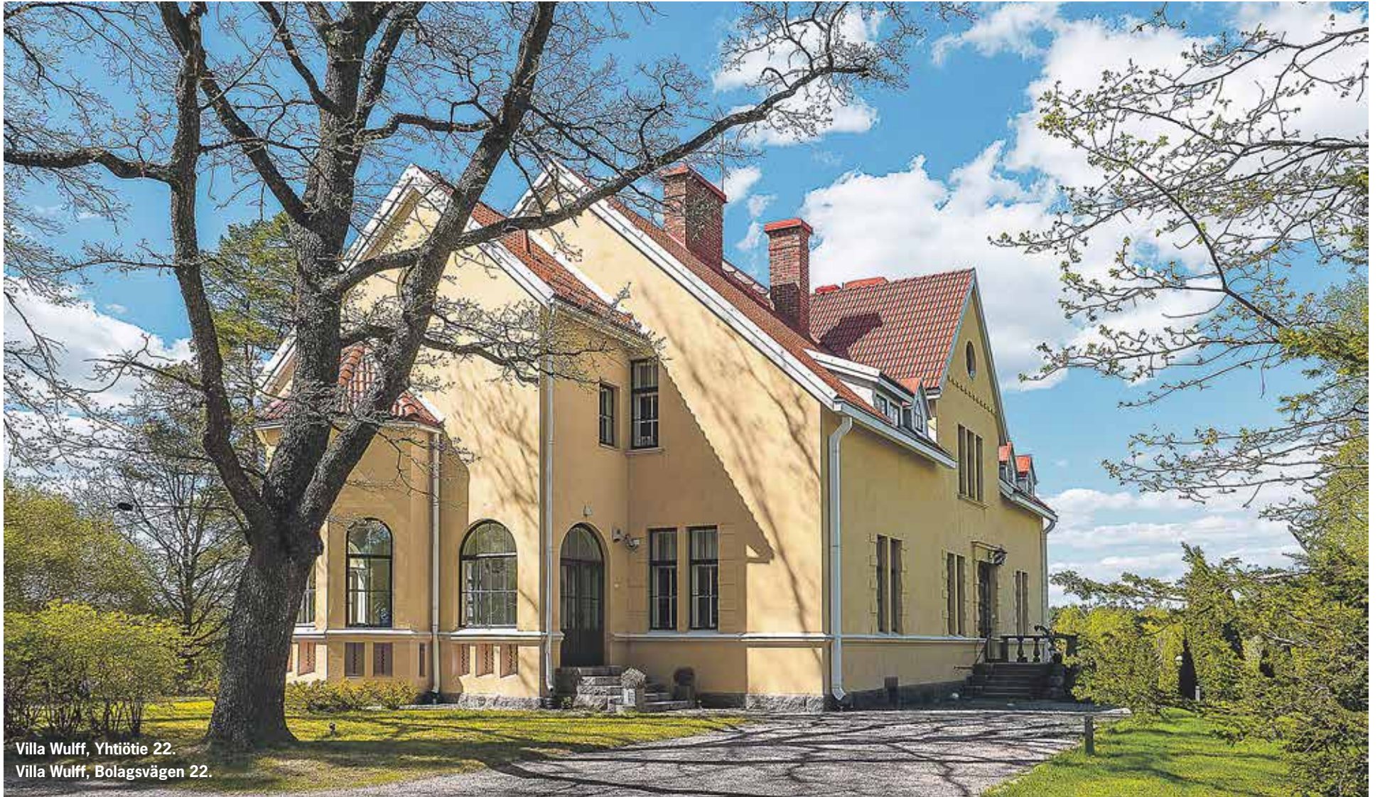
Villa Wulff, Yhtiötie 22. Villa Wulff, Bolagsvägen 22.