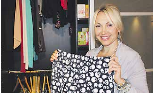
Studiossa on myös oma myymälä. I studion finns också en egen shop.

sjukdomen handlade om och riktigt ordentligt öppnades ögonen under en månadslång kurs i Thailand.