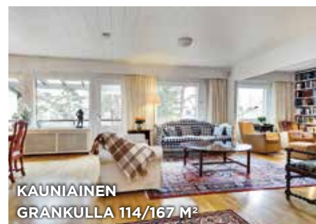
KAUNIAINEN GRANKULLA 114/167 M 2