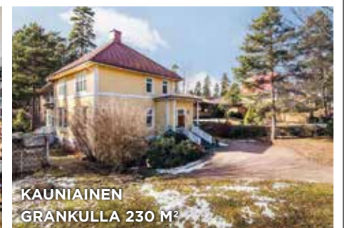
KAUNIAINEN GRANKULLA 230 M 2

RT 4h, k, kph, s, wc, vh, at, parv. Elk:D Mh. 620 000 €. Kavallintie 2 RH 4r, k, bdr, b, wc, klädr, gar, balk. Ekl:D Fp. 620 000 €. Kavallv. 2 Tied./Föfr. C. Nyberg 050 410 5138 9723233