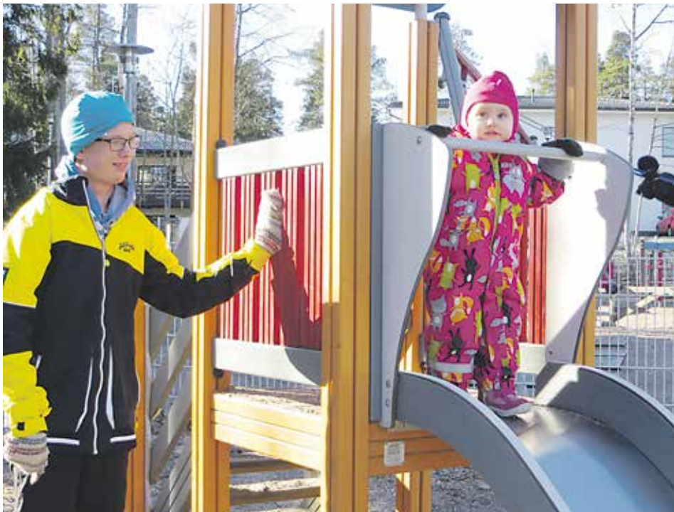
Totin työtehtäviin kuuluu muun muassa ulkoleikkien valvominen. Till Tottis arbetsuppgifter hör bland annat att övervaka utelekarna.