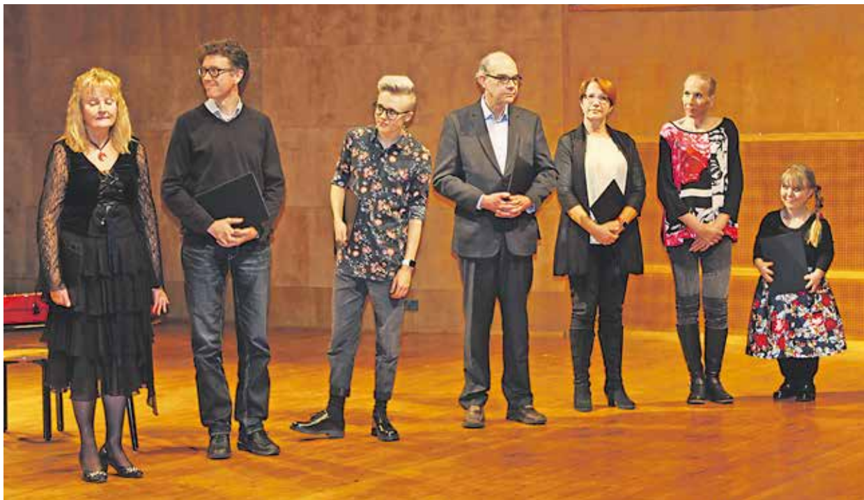
Kuvassa juhlassa olleet apurahansaajat. Bild på stipendiemottagarna som deltog i festen.

Föreningens grundare år 1999 var Esbo Krigsveteraner rf, Esbo och Grankulla städer, Kyrkslätt kommun, Aaltouniversitetet och stadsdelsförbundet i Esbo. År 2018 hålls årsfesten i Kyrkslätt.