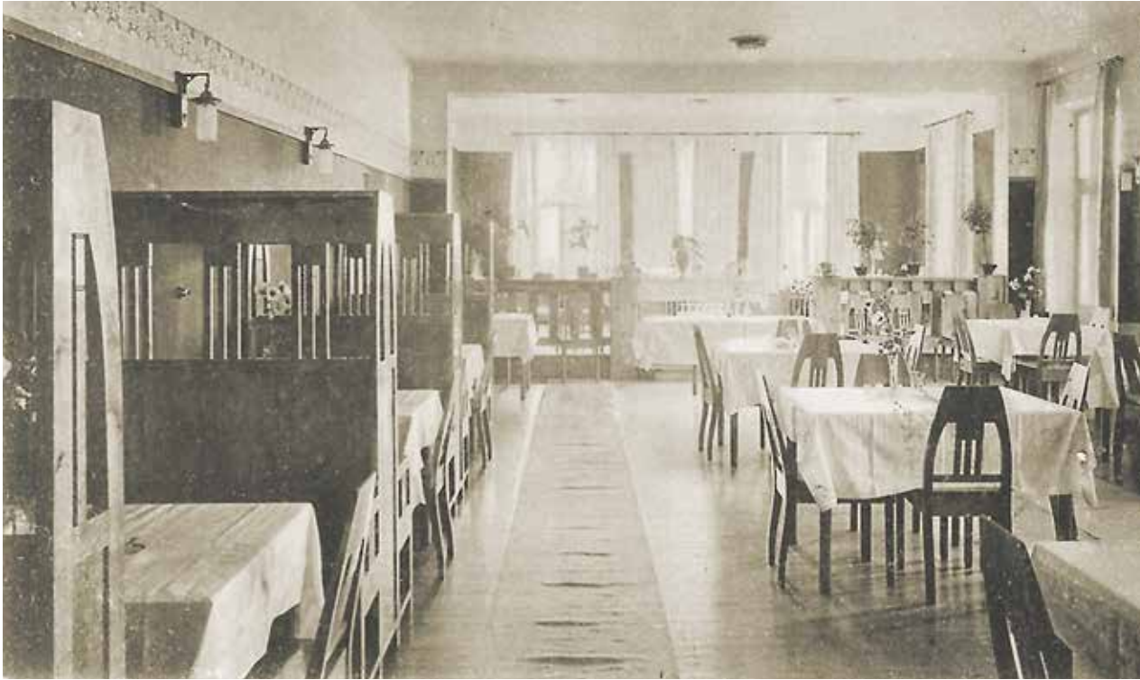
Matsalen på Bad Grankulla sådan den såg ut då Kerenskij åt sina måltider här. Kortet är skickat 1.12.1911. Rummet har försvunnit in i nya ombyggnader på gamla sidan.

Vuoteen 1912 mennessä Kauniaisiiin oli muodostettu 497 kiinteistöä. Sähkö oli saatu 1910. Vuoden 1917 puhelinluettelossa 141 henkilöllä oli oma puhelin. Asukasluku oli 1 662.