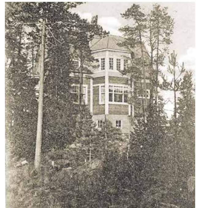
Vid Stationsvägen 13 fanns en stor villa, den sk Pettersons villa. Kortet är poststämplat 20.2.1913. På 1970-talet byggdes Medix på platsen och nu kommer även den byggnaden att rivas för våningshus.

Källor: Finlands Frihetskrig, del II, 1935, s 546-548, Kaunis Grani nr 12/2013 (Kerenski), Grankulla samskolas bildarkiv (det sk skolmuseet), Det lokalhistoriska arkivet i Villa Junghans, På Grankulla bibliotek finns 5 olika böcker om Grankullas historia