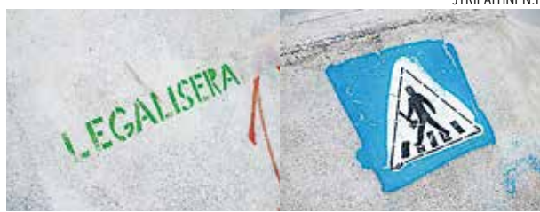
Texten "legalisera" finns på flera ställen i parken. Teksti "laillistakaa" on puistossa monessa paikassa.