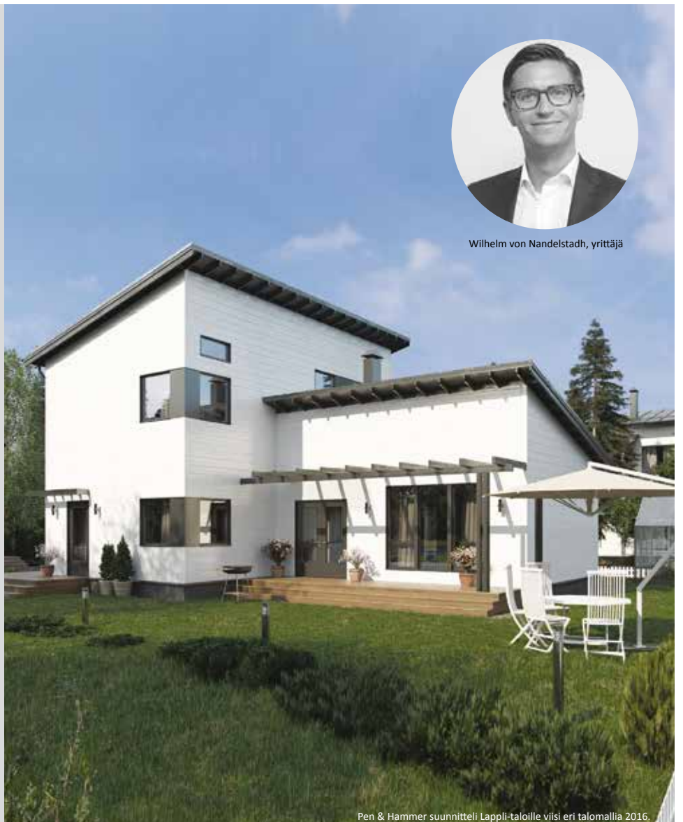
Pen & Hammer suunnitteli Lapli-taloille viisi eri talomallia 2016.