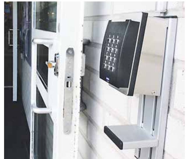
Syöttämällä ulko-ovella olevaan lukijaan kirjastokortin ja pin-koodin asiakas pääsee kirjastoon.

Genom att mata in kortet i kortläsaren och knappa in pin-koden kommer kunden in i biblioteket.