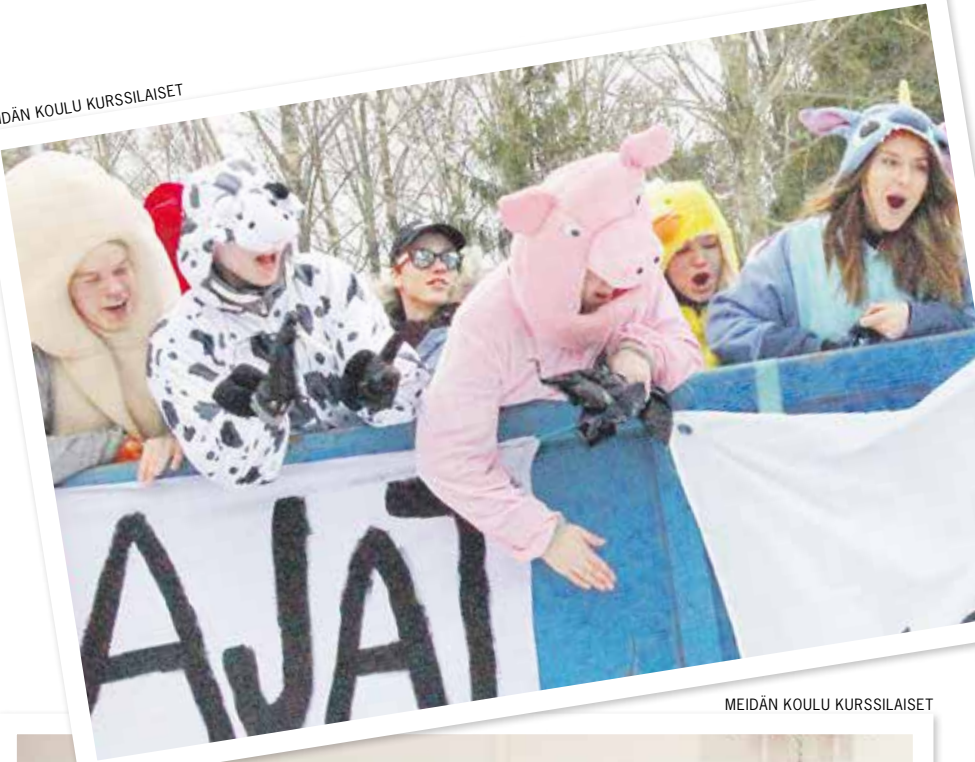
MEIDÄN KOULU KURSSILAISET