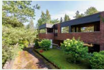
Bembölenie 6h,tkh,rt,k,s-os,erill. wc,kph,khh,2 ak 295 m 2 vh 748 000 €

Kutsu meidät maksuttomalle Kotikäynnille! Vi betjänar Dig gärna på svenska.