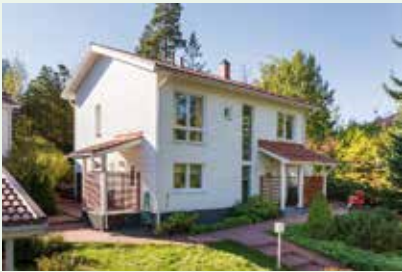
Rantamajantie 4 4h,k,rt,2 erill.wc, ask,khh,s-os,var 169 m 2 / 212 m 2 vh 778 000 €