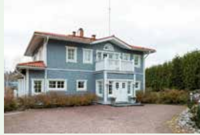
Pohjoinen Heikelintie 23 7h,k,arkioh,s-os,ask.h, 2xerill.wc,kph,var,ak 213 m 2 / 333 m 2 vh 1 190 000 €