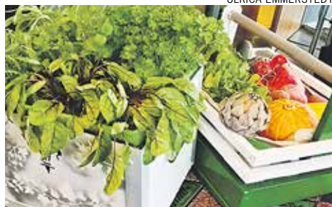
Enemmän tietoa kaupunkiviljelmästä Kaunis Grani ssa heti ensi vuoden alussa.

Mer information om cityodling i Kaunis Grani genast i början av nästa år.