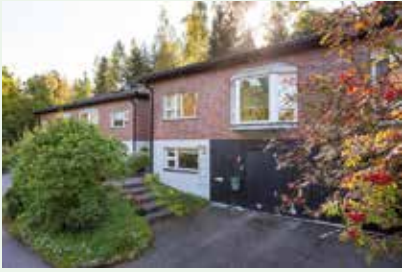
Eteläinen Heikelintie 12 4h, k, s-os., ask.huone, var., at 155 m 2 vh 465 000 €