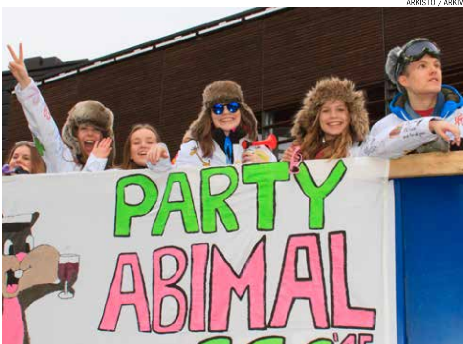
ARKISTO / ARKIV