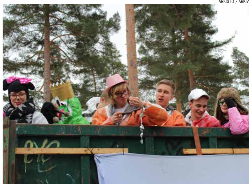
ARKISTO / ARKIV