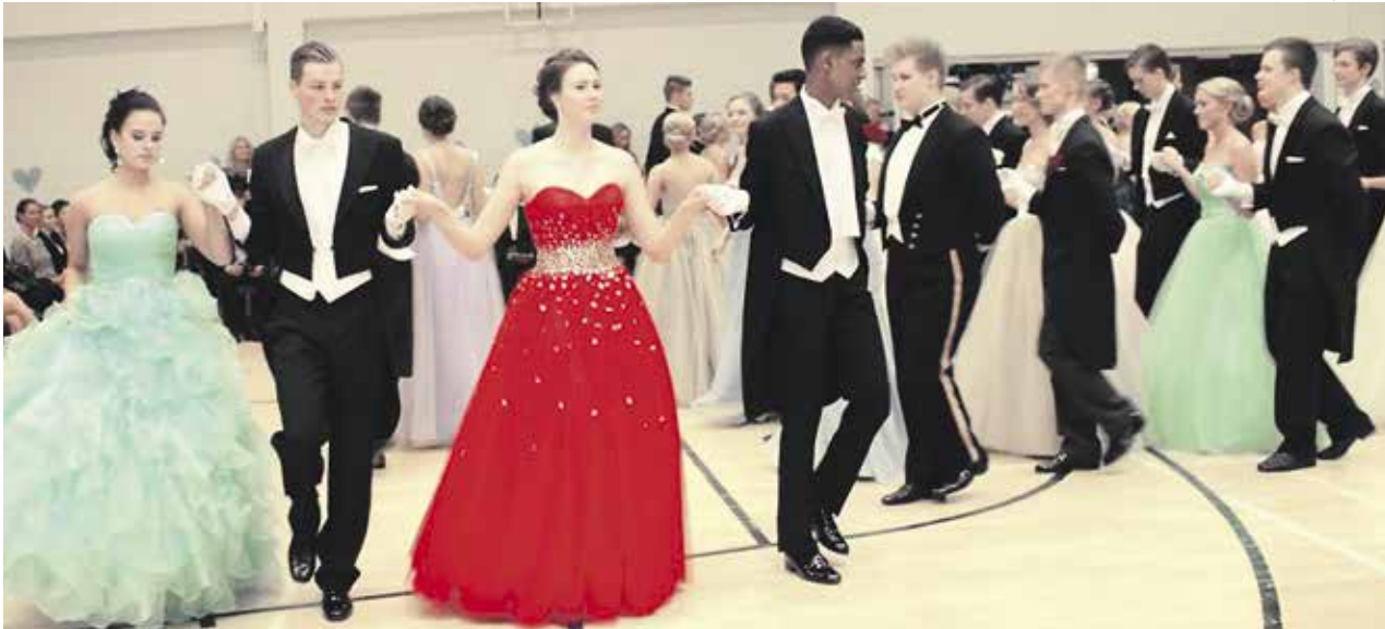
ARKISTO / ARKIV