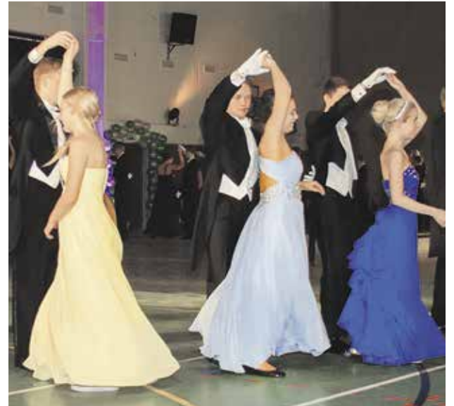
ARKISTO / ARKIV