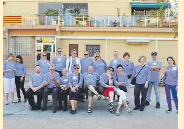
GÖR Calellassa lokakuussa 2014. Kevätkonsertissa esiintymisasuna on sama iloinen Marimekko-paita.