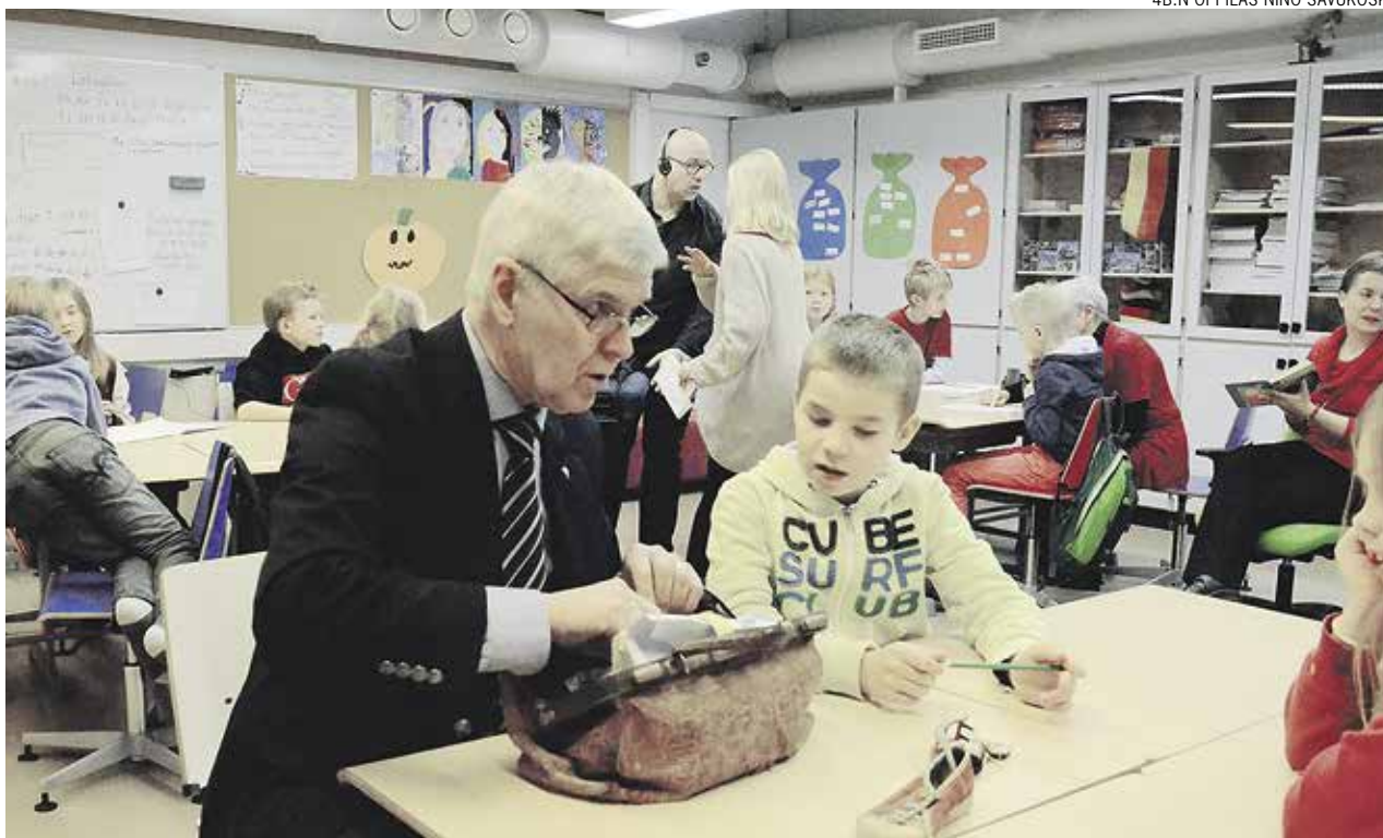
Mitähän vaarin laukusta löytyy?