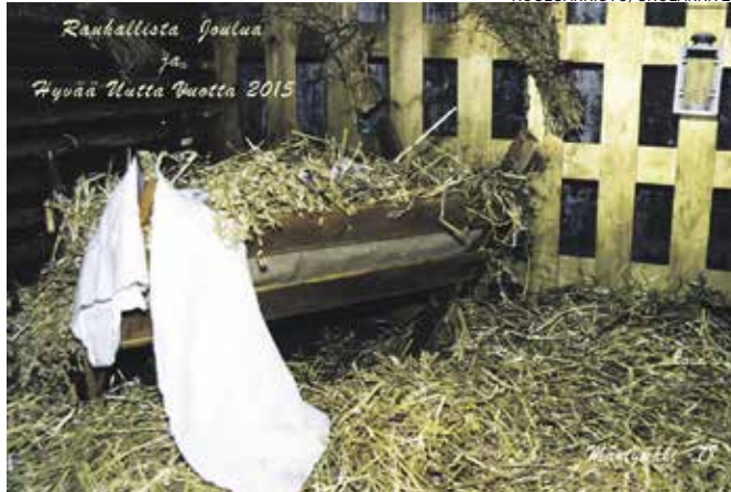
Mäntymäen rakas, vanha seimi.