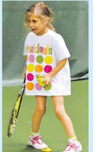
Tove on pelissä mukana.