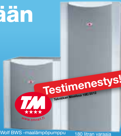
Wolf BWS -maailämpöpumppu 180 litran varaaja

Wolf eli lämpösusi (Canis lupus calor) on suden (Canis lupus lupus) pienikokoinen saksalainen serkku. Se viihtyy asuinkiinteistöjen lämmönjakohuoneissa ja ulottaa reviiirinsä tiloihin, joihin perinteinen maalämpö ei mahdu. Peto asettuu minkä tahansa varaajan viereen ja palvelee isäntäänsä vuosikymmeniä uskollisesti, luotettavasti ja äänettömästi.