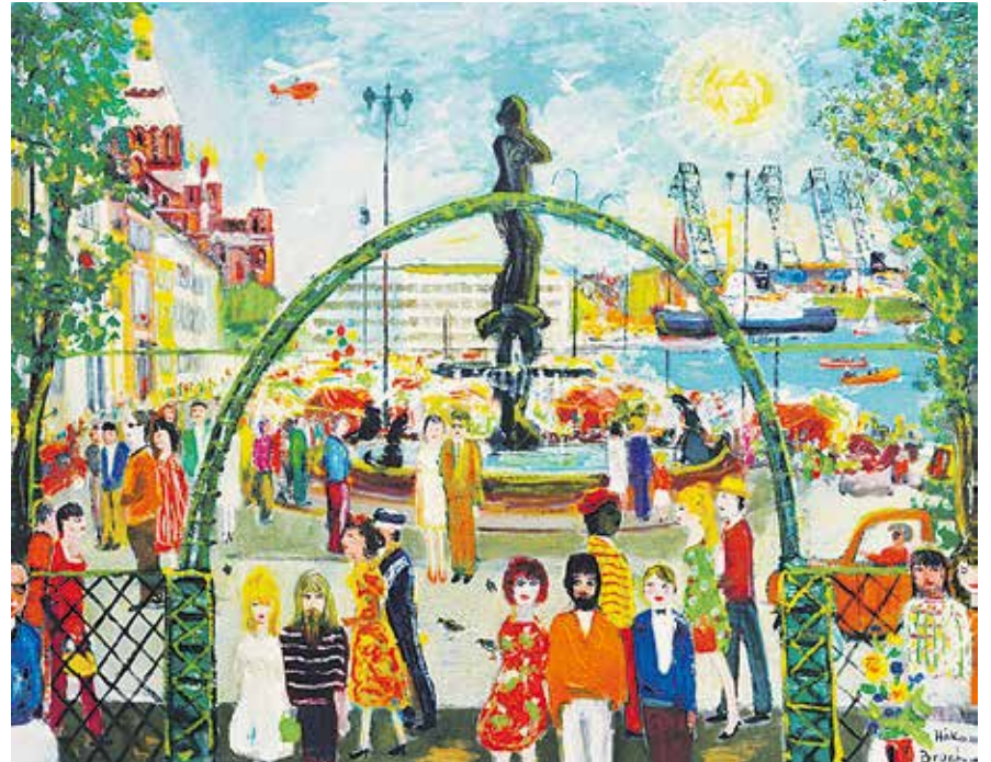
Håkan Brunberg "Kauppatori/Salutorget", 1970-luku/-talet, öljyvärimaalaus/oljemaalning. Kirjasto/Biblioteket.