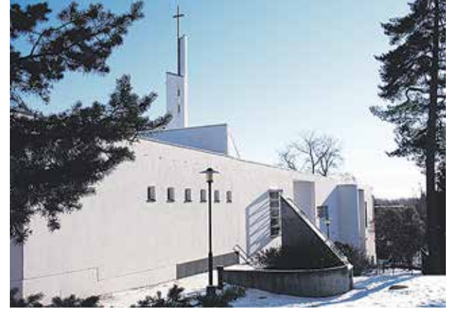
Alvar Aallon hengessä rakennettua modernia, valoisaa ja symboliikkaa täynnä olevaa kirkkoa on ihailtu Venetsian biennaalia myöten.

KAUNIAISTEN SEURAKUNNAT/GRANKULLA FÖRSAMLINAR