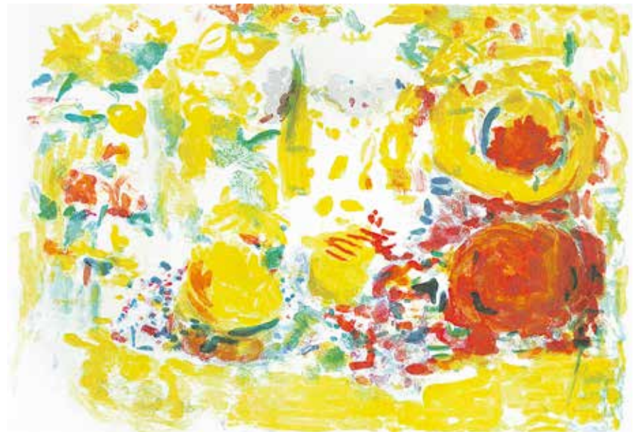
Rafael Wardi "Asetelma auringossa II/Stilleben i sol II" 1994, grafiikka, litografia/grafik, litografi. Tammikumpu/Ekkulla.