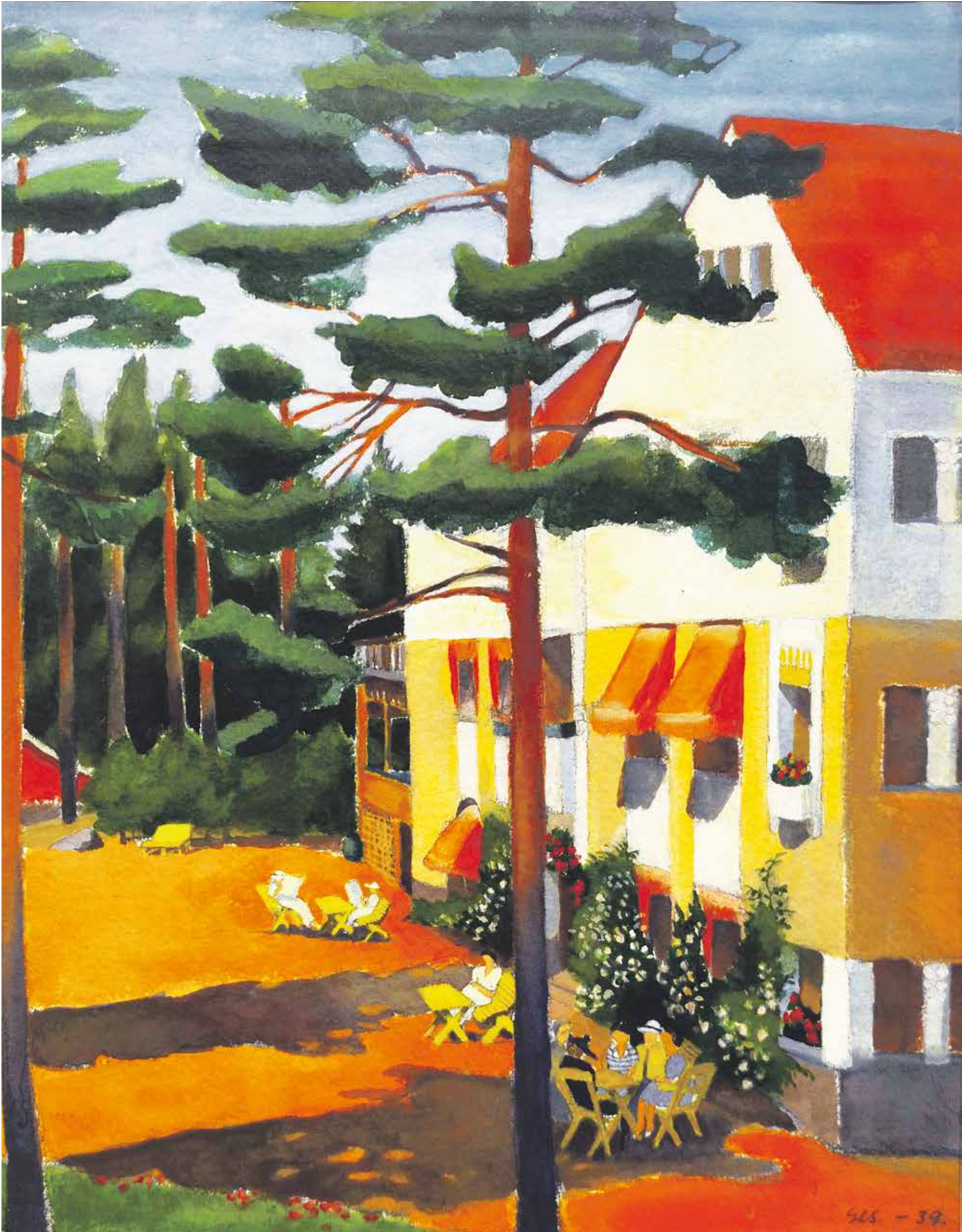
Greta Hällfors-Sipilä "Kylpylä/Bad Grankulla" 1939, akvarelli/akvarell. Kaupungintalo. Stadshuset.