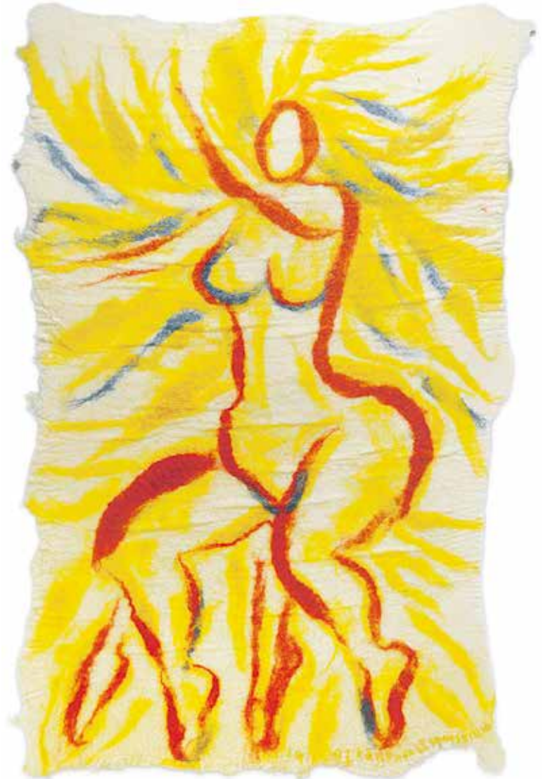
Kristina Lehmuskallio "Tulinainen/Eldkvinna" 1995, huovutus/tovat verk. Terveyskeskus/Hälsocentralen.

Projekti on tehty yhteistyössä Helsingin yliopiston taidehistorian laitoksen kanssa. Sen on laatinut ja toteuttanut humanististen tieteiden kandidaatti Tiina-Kaisa Vilkki.