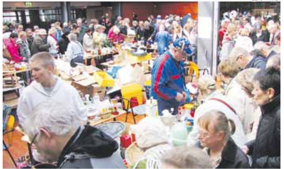
Kauniaisten Lionsien perinteinen kirpputori taas 22.4. klo 12-14 Kasavuoren koululla.

Kauppakeskus Grani, Tunnelitie 4, 02700 Kauniainen, p. (09) 2311 0300 www.kiinteistomaailma.fi kauniainen@kiinteistomaailma.fi