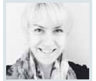
KIRSI LASSOOY FREEDOM FUND ARENA