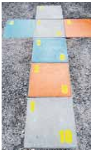
KAUNIAIAISTEN KAUPUNKI / GRANKULLA STAD