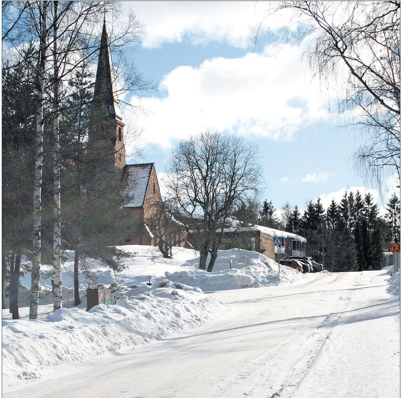
Liikenne tulee olemaan vilkasta, jos uusi yhteys avataan. Ymmerstasta Ersintietä Kauniaisiin ajavat autoilijat tulevat kääntymään Yhtiöntielle, ja joko ajavat suoraan mäen yli Metodistikirkon ohi Kauppalantielle, tai sitten he kääntyvät vasemmalle kirkon puolelta Kirkkotielle.

– Tiehän on jo olemassa meidän puolellamme. Kun Espoo alkaa rakentaa omaa osuuttaan, yhdistämme jalkakäytävät jne. Olemme myös keskustelleet, miten vähennämme läpiajoliikennettä. Se tulee tapahtumaan esimerkiksi leveiden jalkakäytävien avulla ja korottamalla suojateitä.