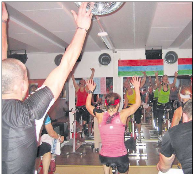
Ymmerstan Movessa järjestettiin sunnuntaina 6.2. hyväntekeväisysspinning.

Extra långt spinning pass på Move till förmån för välgörenhet.