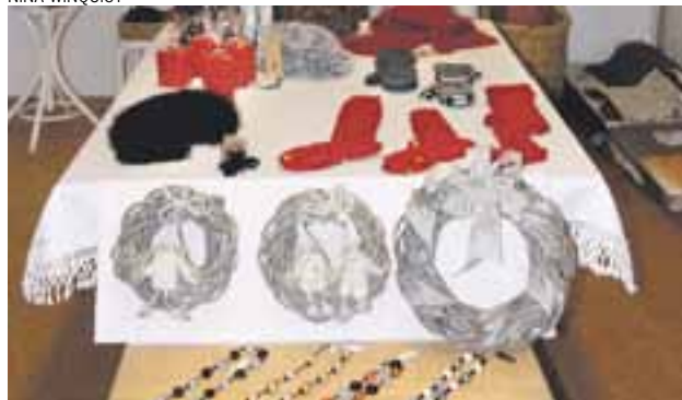
Käsityöläisten joulukransseja löytyy Keltaisen talon vintiltä. Hantverkarnas julkranser fås dagligen i Gula huset.